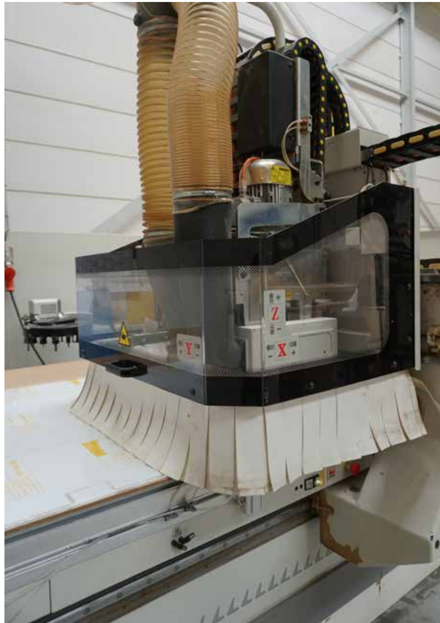
Voor Hypsos betekent samenwerken met Leitz Service dat de bewerkingen en afwerkingen in het transparante kunststof feilloos en smetteloos kunnen worden uitgevoerd.

Harrie Bolk, accountmanager bij Leitz Service, is kind aan huis in Soesterberg. Hij vertelt over de gereedschappen die Hypsos gebruikt: "Onze kunststof frezen worden gebruikt in de CNC-machines,