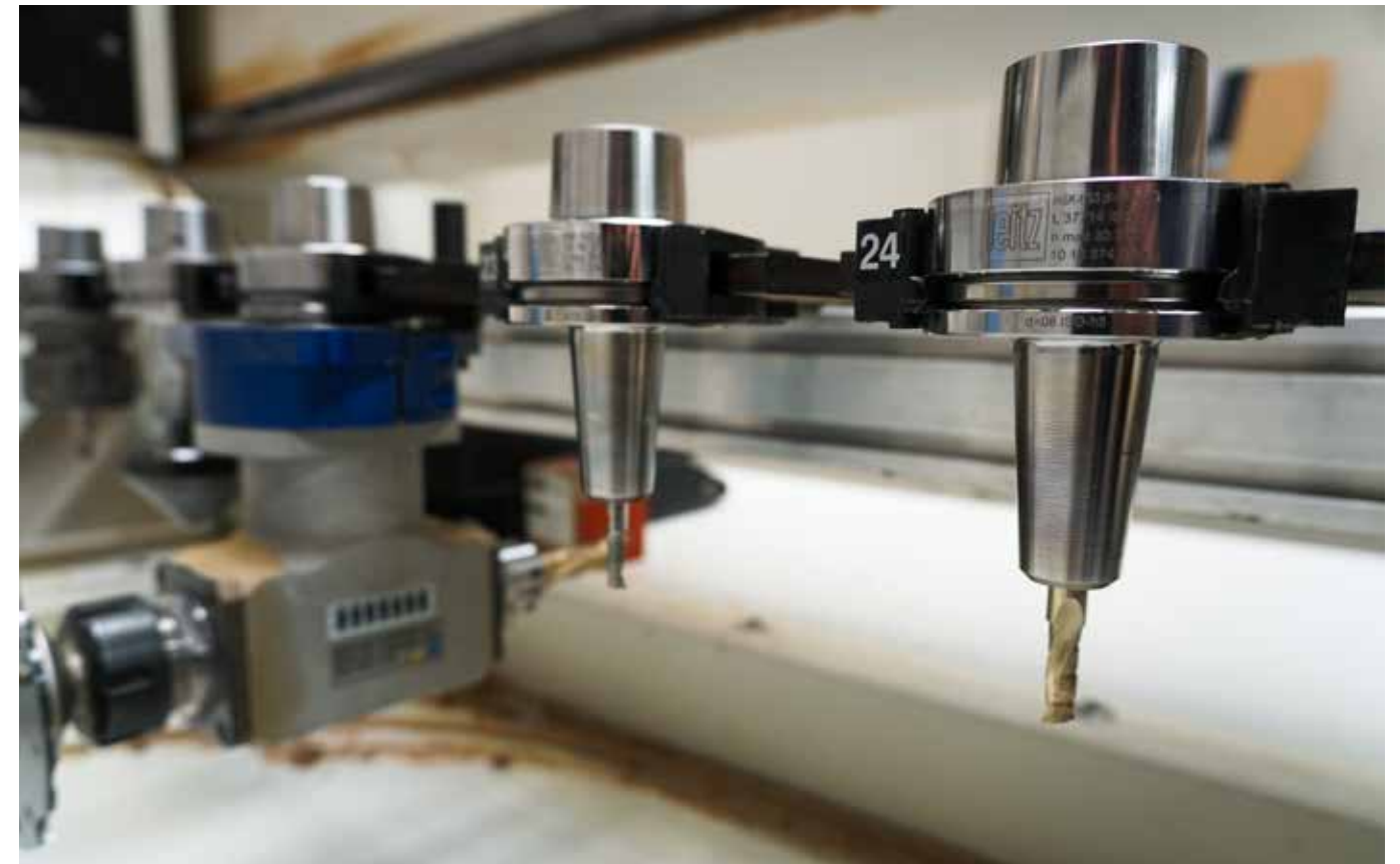
De kunststof frezen van Leitz Service worden gebruikt in de CNC-machines, voor het formateren en boren.

en voor het op maat zagen wordt onze BrillianceCut zaag gebruikt. Deze gereedschappen zijn geschikt voor meerdere soorten kunststof en composietmateriaal, maar blinken nog eens extra uit wanneer